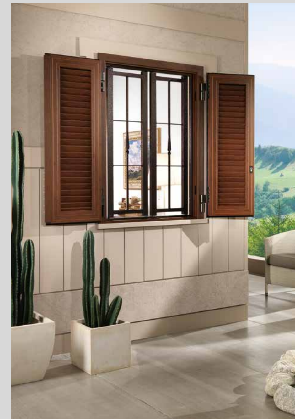
Vista esterna con persiana completamente aperta e grata chiusa. External view with fully open shutter and closed grating.