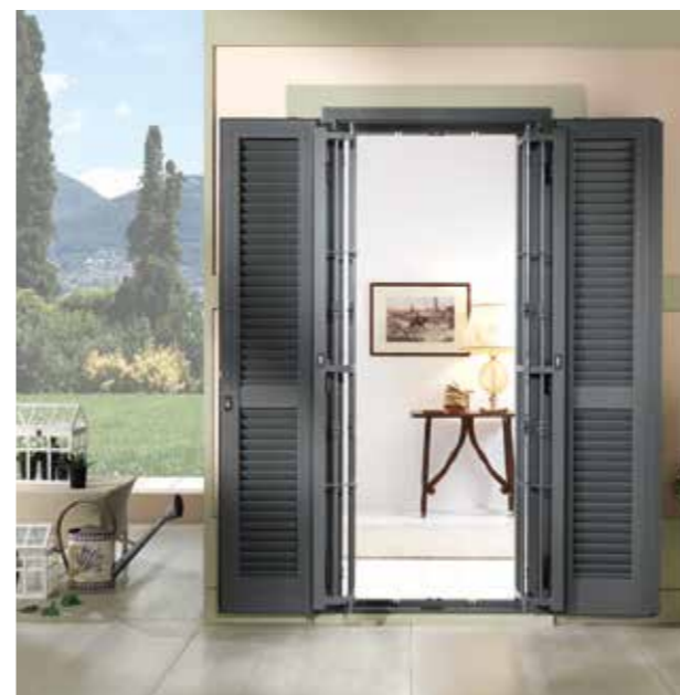
Posizione: Apertura totale Position: Total opening