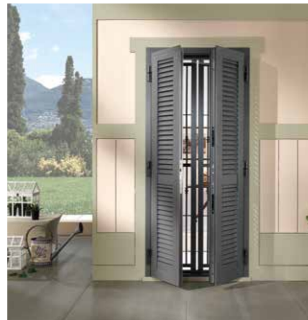
Posizione: Apertura parziale Position: Partial opening

The characteristic of the security bar is the special self-locking joint. The doors are made of galvanized steel profiles with a section ranging from 50x30x2mm thick to 30x30x2mm thick. The ornamental modules are made up of bars full of galvanized steel with a diameter of 14mm. COMBI is made of two types openings: ACS opening 180 with total external opening joint + internal total opening and ASS 180 without total external opening joint + internal total opening. The ACS 180 versions are equipped with a special joint that has a double function, in the opening to fold the leaf completely outwards and a total opening also towards the inside of the room, making it easy to close the shutter or door.