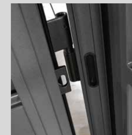
Particolare cerniera e rostro antistrappo Detail of the hinge and anti-tear guard