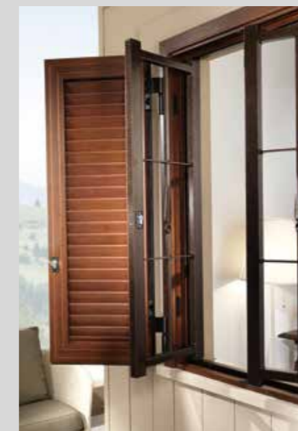
Particolare apertura senza snodo Detail of opening without articulated joint

The PERFEKTA security bar joins the MAXIMA shutter. From the union of two products could not result in a double security. The security that Erreci has always proposed to its customers is combined with the practicality of the elements; hence the COMBI functionality: a single frame with a thickness of only 9 cm and infinite combinations.