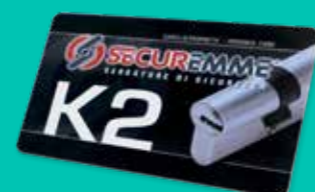
Tesserina di duplicazione chiavi Duplication keys card