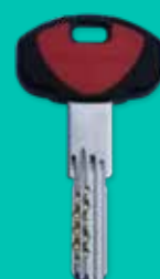
Chiave di cantiere Construction site key