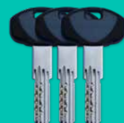
3 chiavi padronali 3 keys