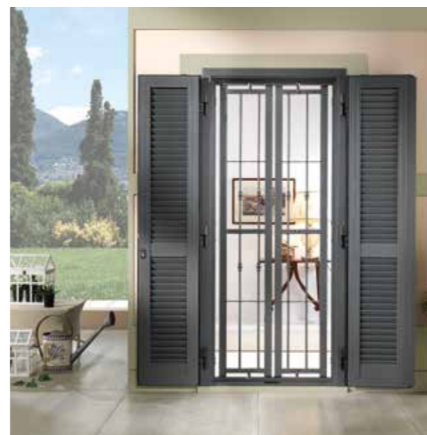
Vista esterna con persiana completamente aperta e grata chiusa External view with fully open shutter and closed grating

L'inferriata PERFEKTA si unisce alla persiana MAXIMA. Dall'unione di due prodotti non poteva che scaturire un risultato di doppia sicurezza. La sicurezza che Erreci da sempre propone ai suoi clienti si coniuga alla praticità degli elementi; da qui nasce la funzionalità della COMBI: un telaio unico con spessore di soli 9 cm e infinite combinazioni.