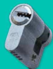
Cilindro di sicurezza K2 Safety cylinder K2